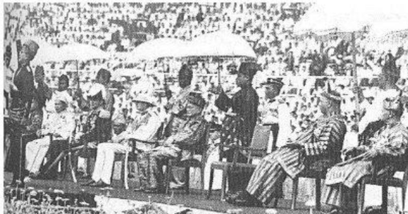
Tunku Abdul Rahman Putra dengan penuh bersemangat mengisytiharkan kemerdekaan Persekutuan Tanah Melayu di Stadium Merdeka, Kuala Lumpur pada pagi 31 Ogos 1957.