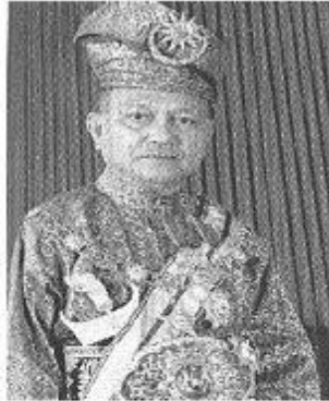
Yang di-Pertuan Agong Pertama Al-Marhum Tunku Abdul Rahman ibni al-Marhum Tunku Muhammad

22. Inilah hasil perjuangan keramat bagi setiap rakyat terdahulu untuk diteruskan kesinambungannya oleh generasi kini yang mencintai negaranya yang berdaulat dan merdeka.